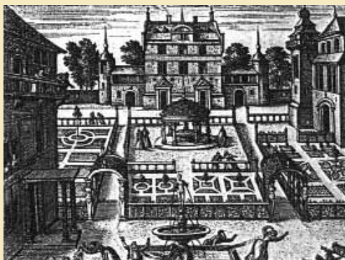
Au temps des surprises hydrauliques

• 15, 16 & 17 mars - Biennale Nature & Paysage - L'eau. L'eau à travers l'histoire, le paysage, l'environnement, l'architecture . La librairie y tiendra un stand le 16 mars. Plus d'informations sur nature-et-paysage.eu