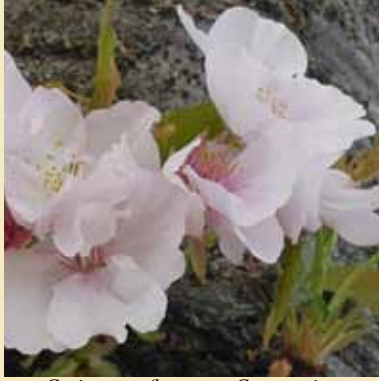
Cerisiers en fleurs rue Constantine

O-Hanami. "Au printemps les japonais partent en quête du "spectacle des fleurs" ( O-Hanami ). La coutume remonte à la période de Heian (794-1185), où elle est seulement le fait de l'aristocratie ; c'est dans la période des Tokugawa ou d'Edo (1603-1867) qu'elle deviendra véritablement un "sport national", des cerisiers en fleurs au printemps aux érables enflammés de l'automne. [...] Les étudiants et autres citadins se pressent au mois d'avril dans les douves du château de Kanazawa, pour de grands pique-niques sous les cerisiers en fleurs. Comme au moment de l'automne en Angleterre, stations de radio et de télévision rendent compte heure par heure du progrès de la floraison des arbres".*